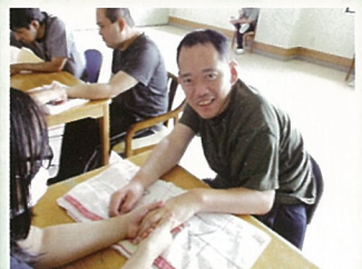
リラクゼーション